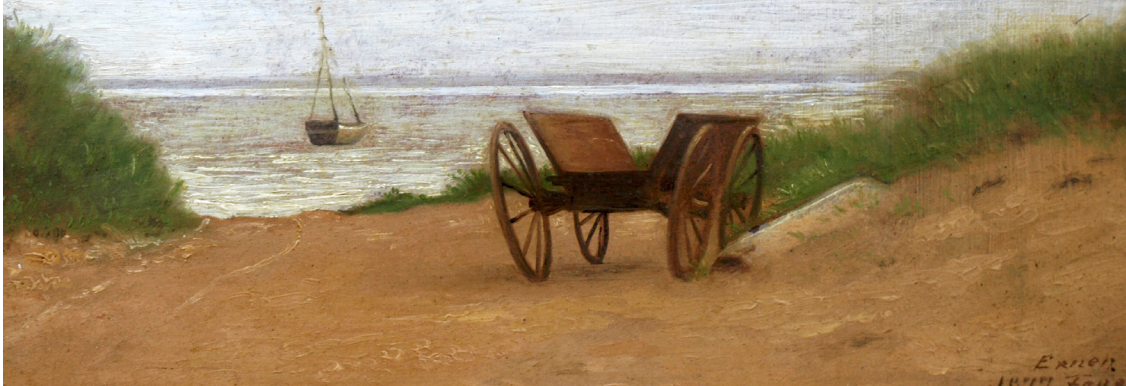
Julius Exner: Arbejdsvogn mellem klitter 1877