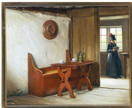
Julius Exner: Der ventes gæster 1891

(tilmelding på post@fanoekunstmuseum.dk og først til mølle. Der gives besked om optagelse)