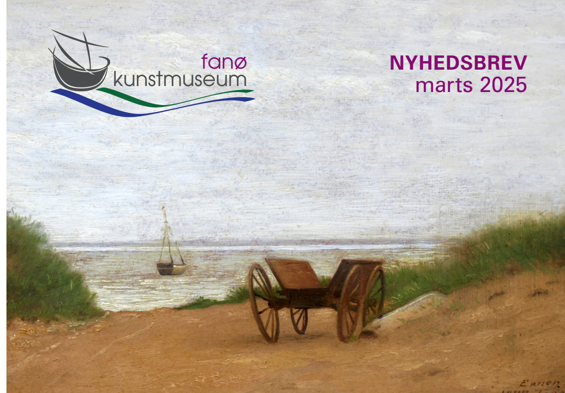
Julius Exner: Arbejdsvogn mellem klitter 1877