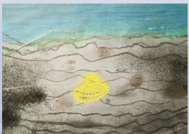
Theodor Kuhn, 7 - 12 år/ Jahre