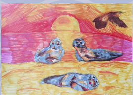
Anna Klipstrup, unge/ jugendliche 13 - 18 år/ Jahre