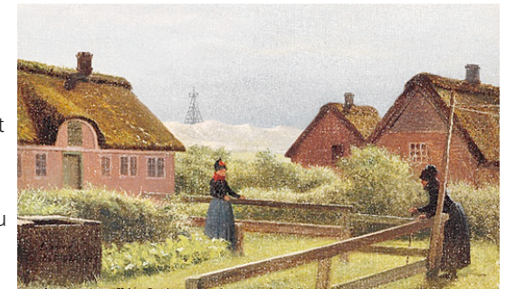
Parti fra Sønderho med to kvinder og sømærket. Sign. Exner Sønderho 1896. Olie på lærred. 22 x 36. Privateje.