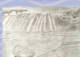
Iovni Edmund Gjeller, unge/ jugendliche 13 - 18 år/ Jahre