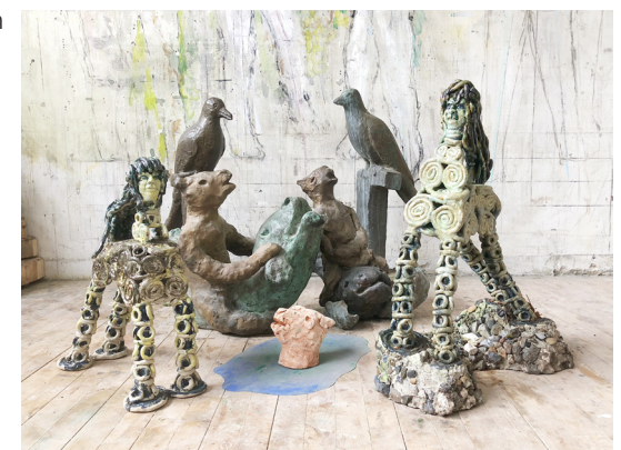
Fabeldyr af Tine Hecht-Pedersen og Pontus Kjerrman