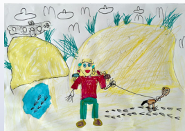
Helle Becker, under/unter 7 år/ Jahre