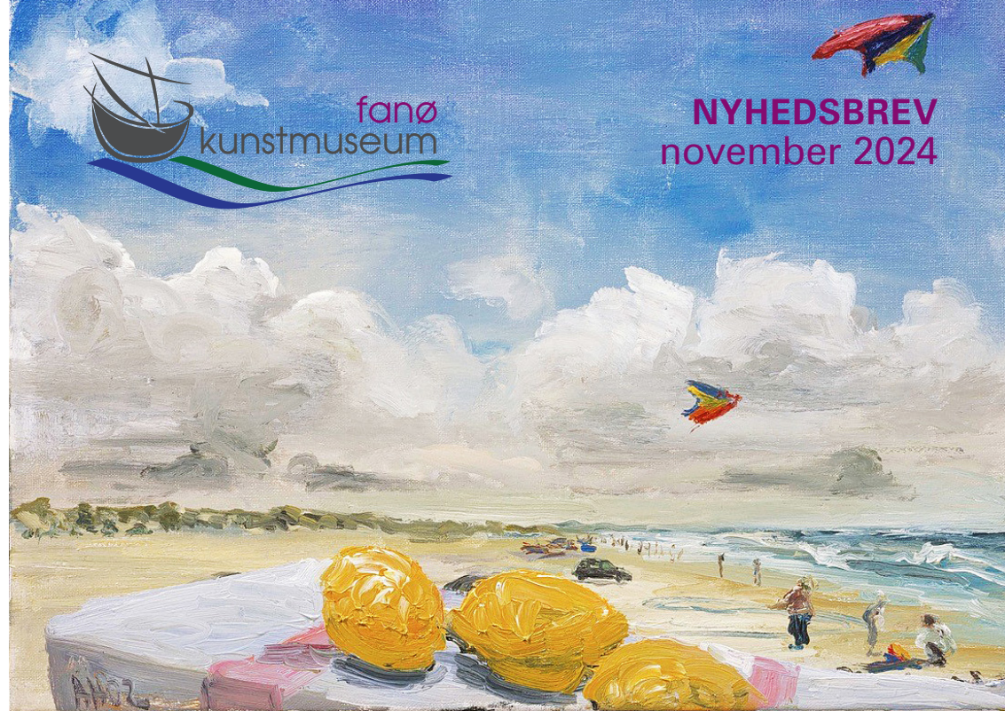
Drager på stranden på Fanø af Anton Henning