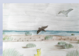
Karla Witkovic, 7 - 12 år/ Jahre