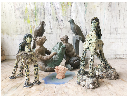
Fabeldyr af Tine Hecht-Pedersen og Pontus Kjerrman