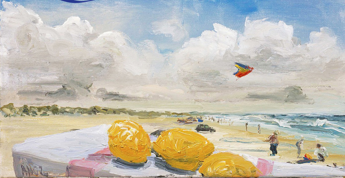
Drager på stranden på Fanø af Anton Henning