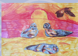
Anja Wijnstrup, unge/ jugendliche 13 - 18 år/ Jahre