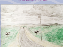
Luka Gjero, unge/ jugendliche 13 - 18 år/ Jahre