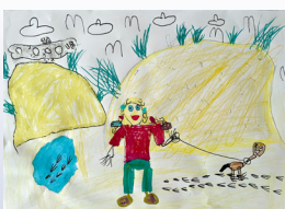
Hollie Becker, under/unter 7 år/ Jahre