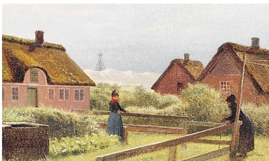
Parti fra Sønderho med to kvinder og sømærket. Sign. Exner Sønderho 1896. Olie på lærred. 22 x 36. Privateje.