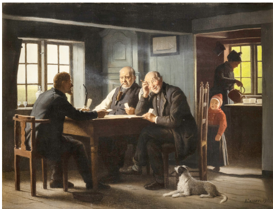
Interiør med kortspillere. Sign. Exner 1900. Olie på lærred. 29 x 38. FKM