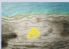
Theodor Kuhn, 7 - 12 år/ Jahre